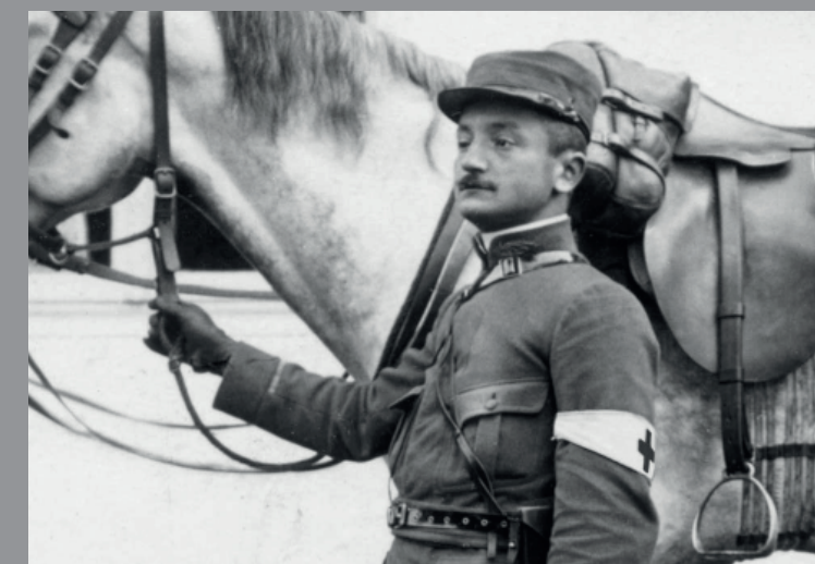
Un officier de santé français pose pour le photographe Louis Henry à Frenois, mi-août 1914

entre les champs de bataille et les ambulances de Rossignol et de Jamoigne Un épisode de la guerre 1914-18