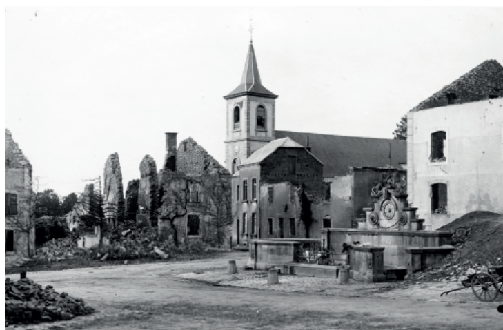
Tintigny incendié par les Allemands.