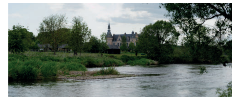
La Semois près du château de Faing.

Le 21 Août, le GQG français (Grand Quartier Général) décide que le lendemain 22 on attaquerait l'Allemand partout où on le trouverait de l'Alsace à la mer du Nord. C'est le début de « La bataille des Frontières » qui deviendra la journée la plus meurtrière de l'armée française. Des communes de notre belle région vont devenir des villages Martyrs. Musson, Baranzy, Halanzy, Signeulx, Gomery, Bleid, Mussy, Ethe, Latour, Virton, Robelmont, Bellefontaine, Tintigny, Poncelle, Rossignol, Neufchateau, Ochamps, Maissin, Anloy, etc ... vont être des champs de bataille où les civils seront assassinés et les maisons incendiées par centaines. Cette barbarie continuera les deux jours suivants dans nos villages, les Allemands ayant repris leur marche en avant.