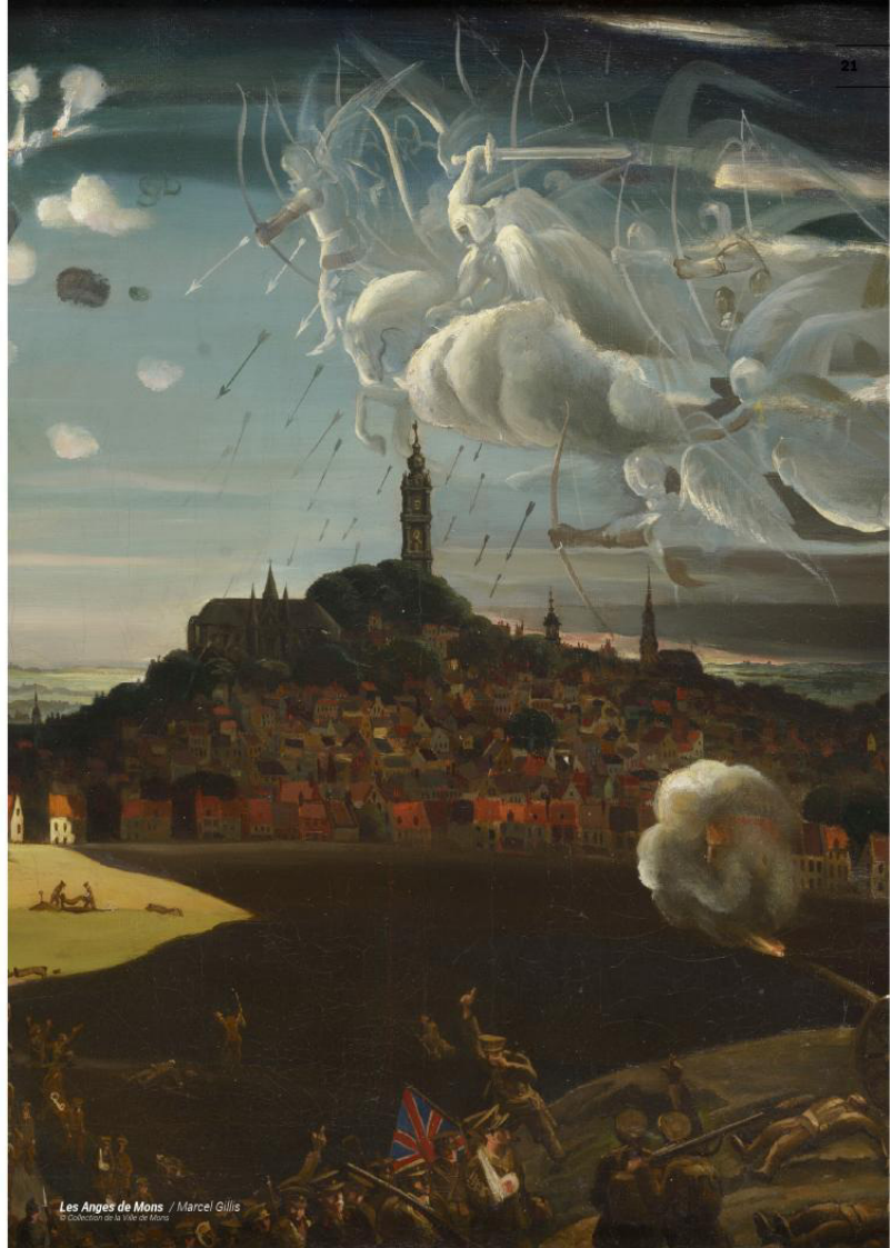
Les Anges de Mons / Marcel Gillis © Collection de la Ville de Mons

Plus d'infos sur www.visitmons.be/fr/decouvrir/mons-14-18/item/191351-projet-interreg-iv-a-la-grande-guerre-corps-armes-et-paix