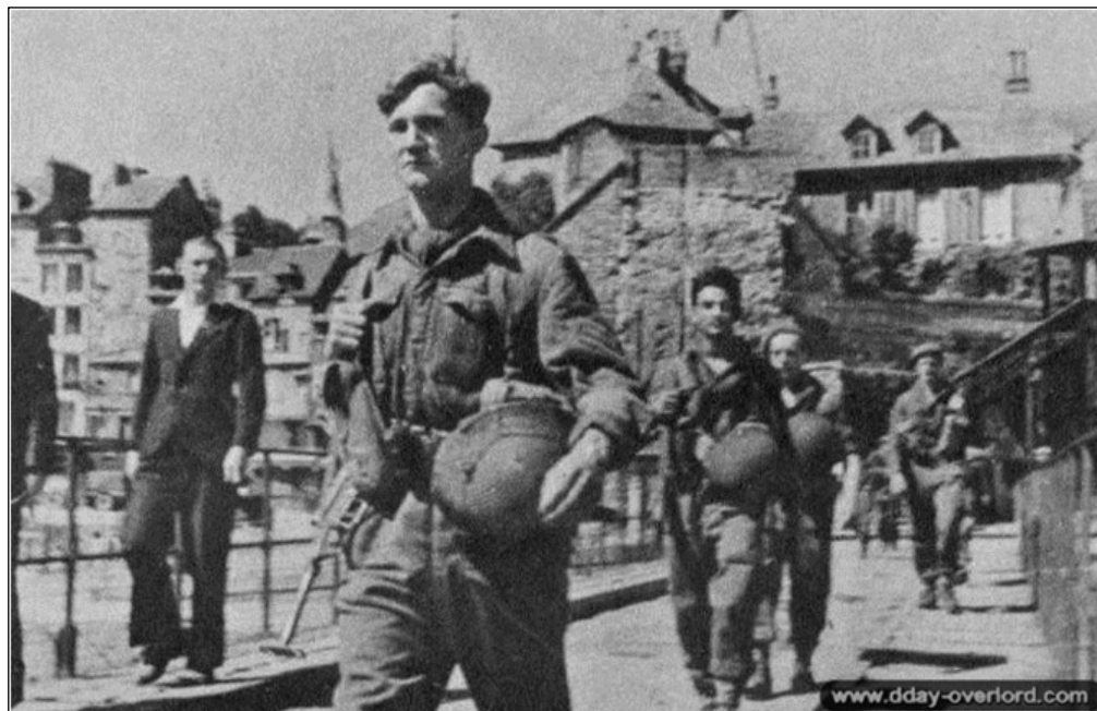
Honfleur, le 25 août 1944