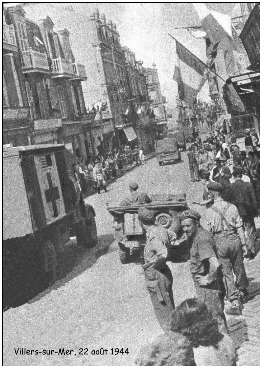
Villers-sur-Mer, 22 août 1944