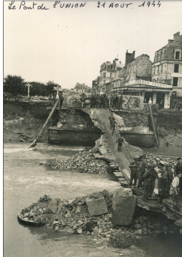
Trouville-sur-Mer, le 25 août 1944