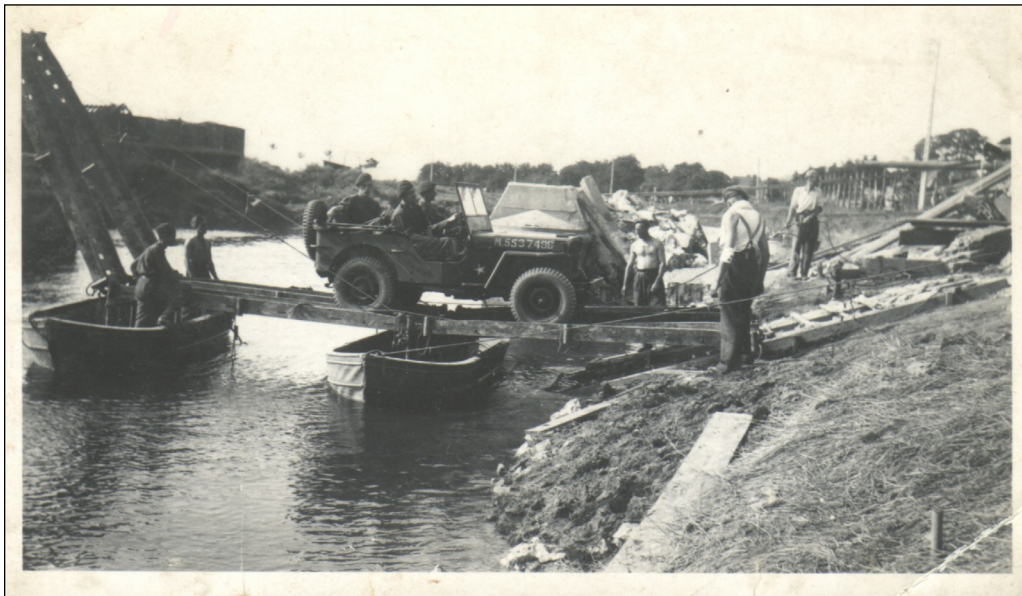
Passage de la Touques entre Saint-Arnoult et Touques