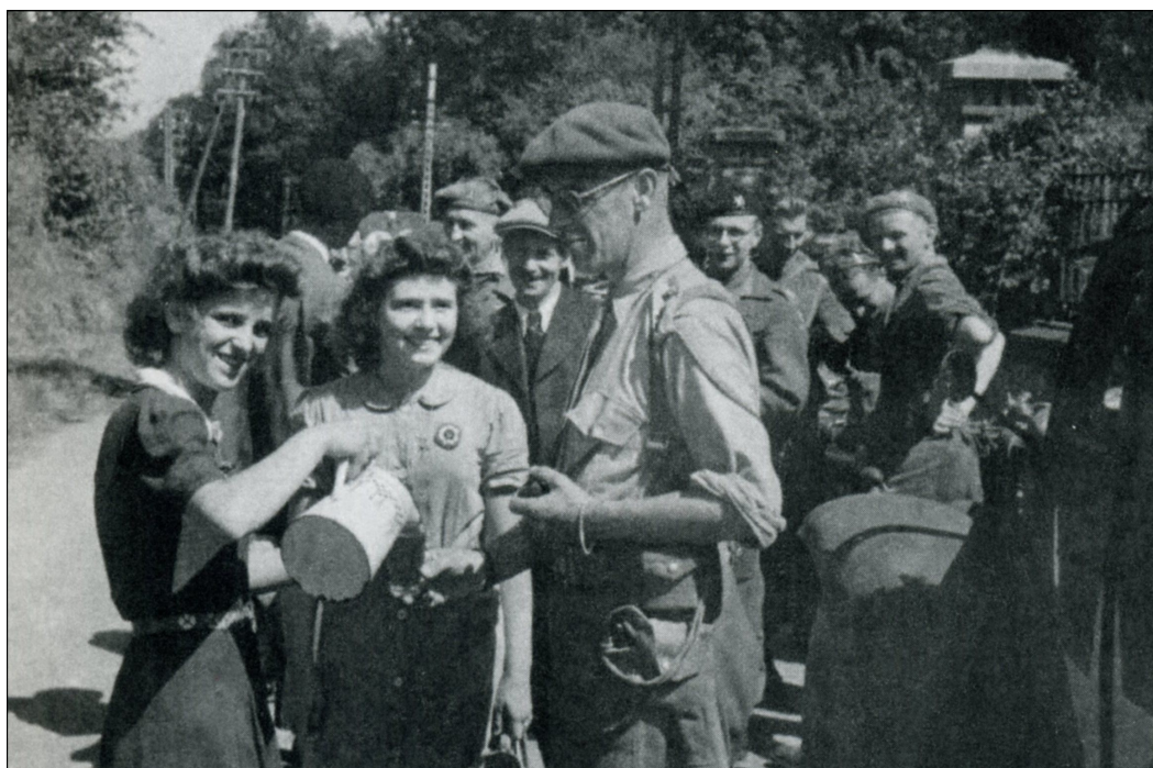
Villers-sur-Mer, le 22 août 1944