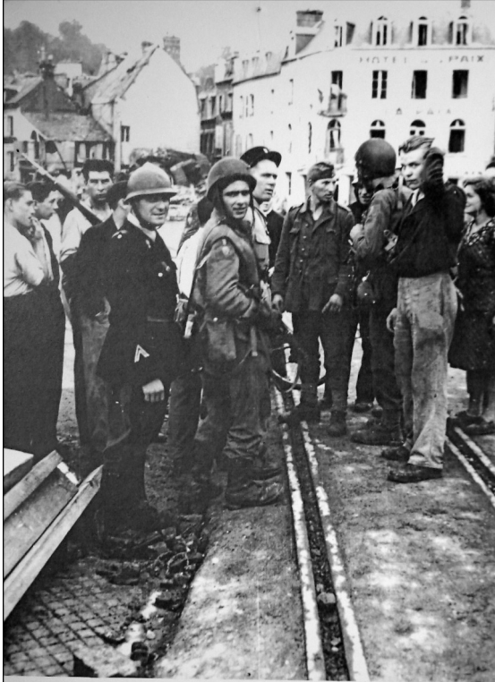
Trouville, le 25.8.1944 Place du pont Soldats Belges et Prisonnier Allemand