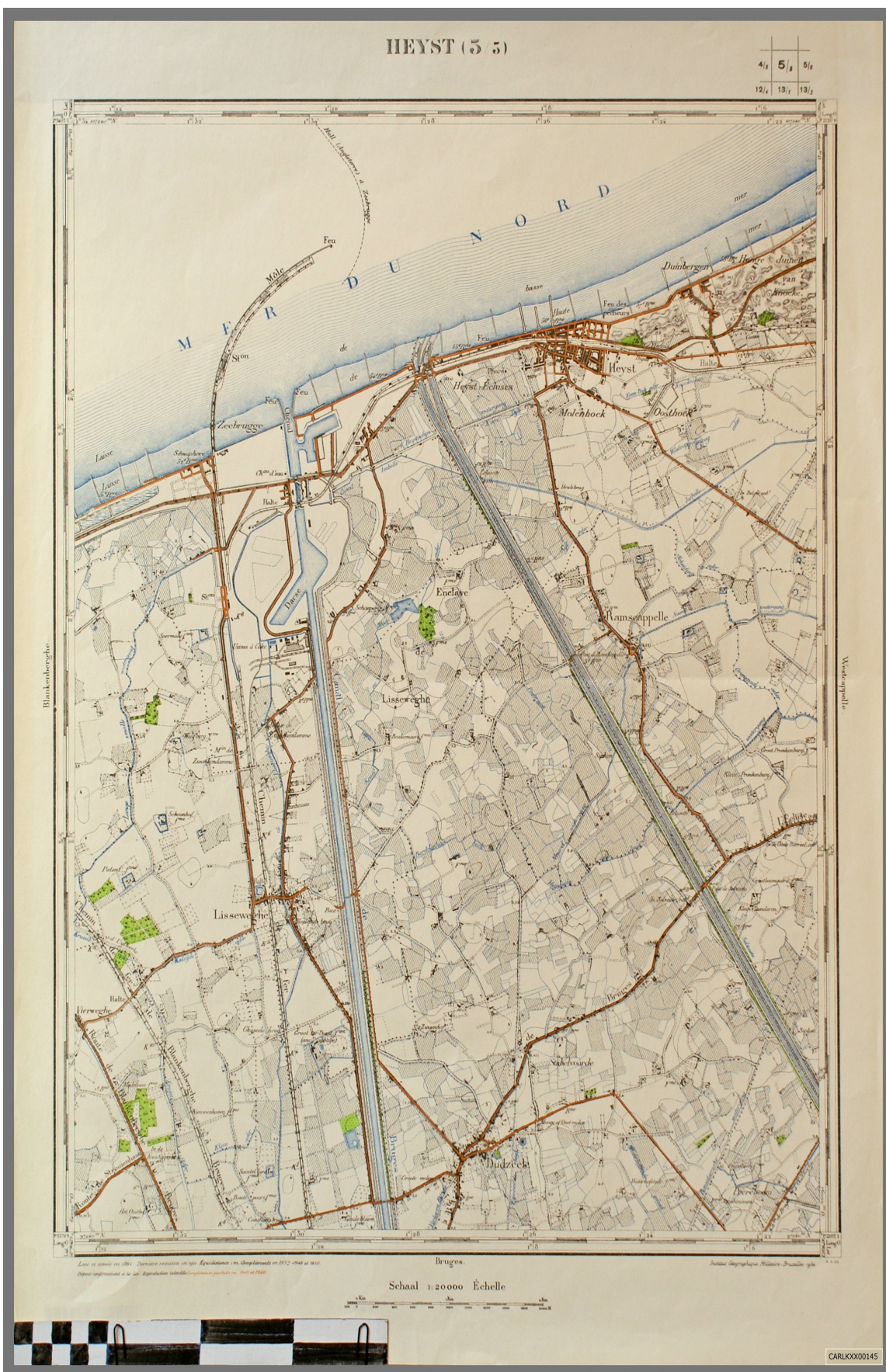
Zeebrugge, Heist, Ramskapelle, Dudzele en Lisseweghe .... 1950