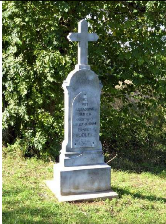
Stèle à la mémoire d'Ernest BODLET située à la Rue de Toernich (route entre Arlon et Toernich)